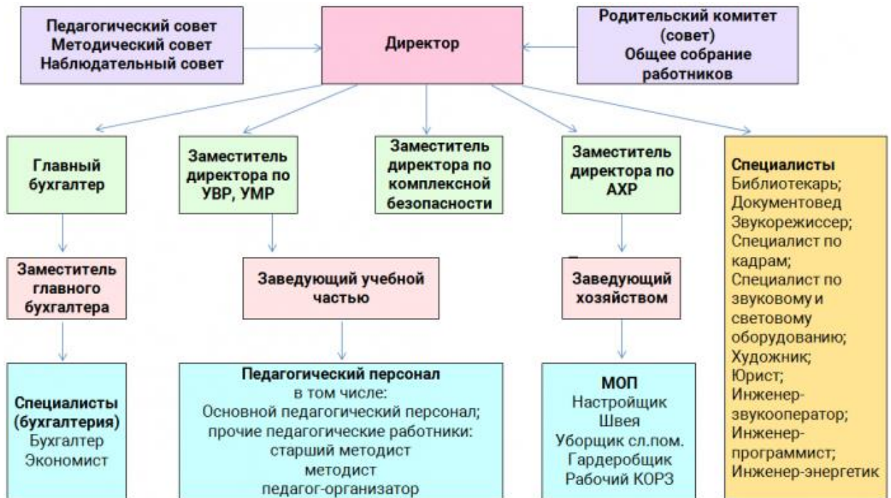
Схема структуры учреждения